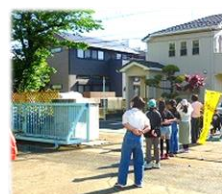
朝のあいさつ運動

これらの取組に共通するのは、「泉小学校やクラスをよりよくするのは自分達だ」という意識や行動力が身に付いてきていることです。将来、泉小学校の子ども達が、助け合い支え合うなど、よりよい地域や社会を築く主人公になることを願い、引き続き、子ども達が主人公の活動を充実させていきたいと思っています。