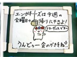
5年生係活動・演劇